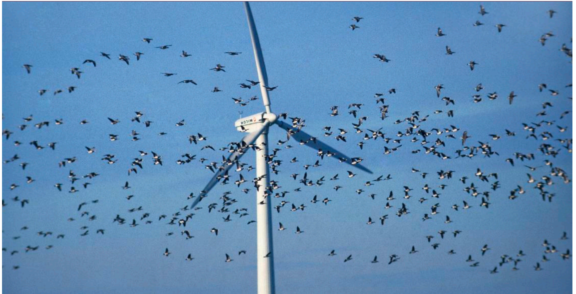
Gefahrenherd in luftiger Höhe: Gegen die riesigen Rotoren sind die Zugvögel chancenlos